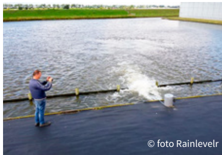
Regenwater wordt vanuit een bassin naar het oppervlaktewater geleid via Rainlevelr.